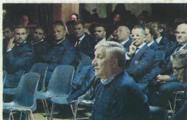
L'onorevole Tajani in primo piano; a destra uno scorcio del salone; Gori e Milana